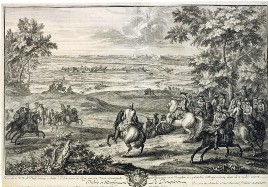
Monsignore Dauphin mit der französischen Armee vor der Festung Philippsburg

Im Jahr 1697 wurde Philippsburg im Friedensschluss von Rijswijk an das Reich zurückgegeben und wurde als wichtige Festung am Oberrhein neben Kehl zur Reichsfestung ernannt.